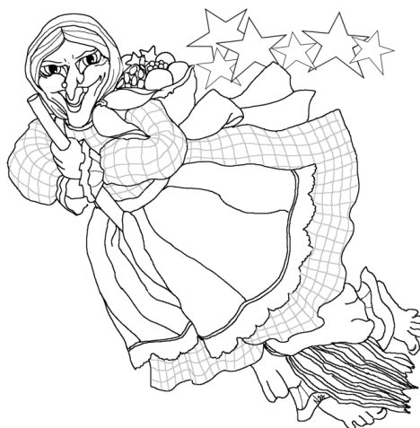
la sorcière Befana