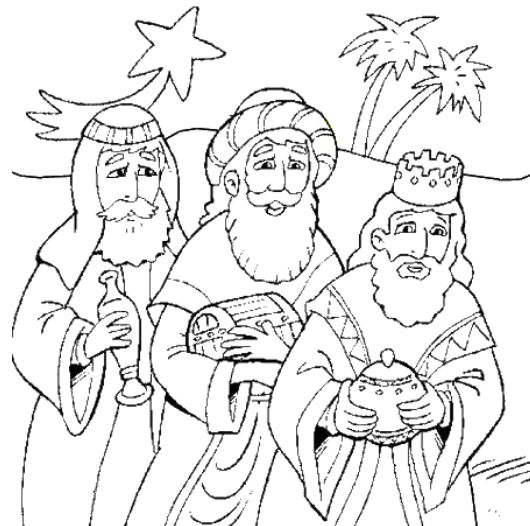
les Rois Mages