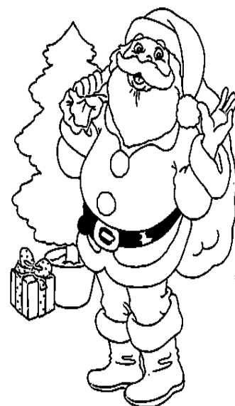
le Père Noël