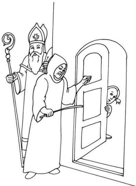
Saint Nicolas et le Père Fouettard